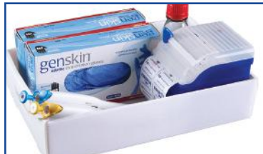
Ideal para almacenar o transportar productos de laboratorio