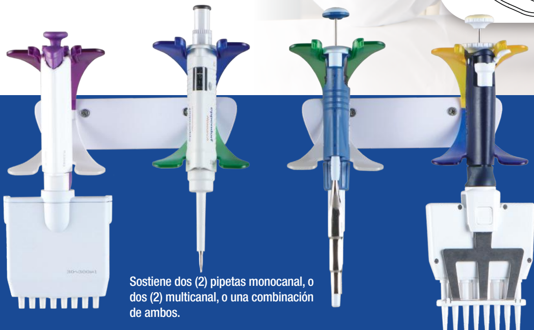
Sostiene dos (2) pipetas monocal, o dos (2) multicanal, o una combinación de ambos.